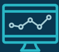
Tabla de Actualización y Conservación de la Información Autoridades administrativas y jurisdiccionales en materia laboral y sindicatos