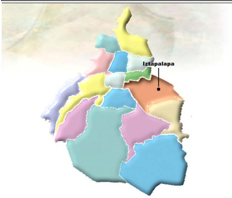
Mapa de la Ciudad de México con la división de las Demarcaciones Territoriales